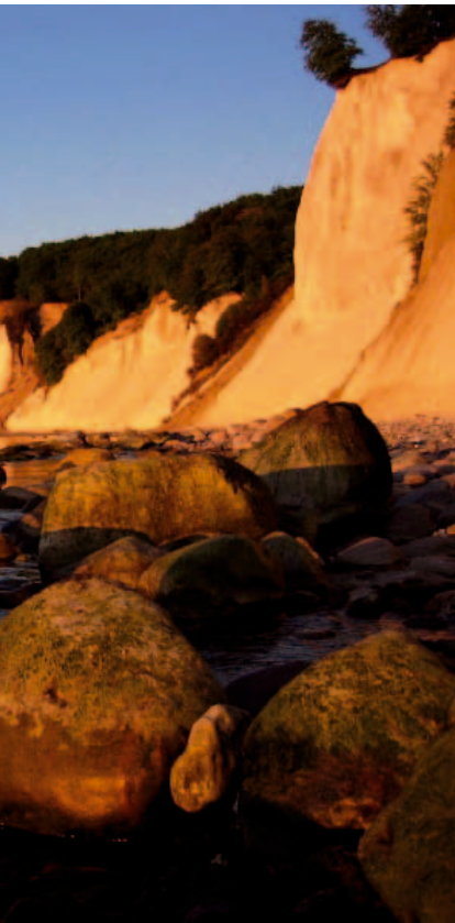
Die berühmten Kreidefelsen an der Küste Rügens

Ob im Rasul- oder Serailbad, als Soft-Pack im Wasserbett, kombiniert mit Algen, Seegras, Sole, Frucht-Trester, Tonerde, Honig, Stutenmilch oder mit duftenden Ölen... ein Bad oder eine Packung mit Rügener Heilkreide fühlt sich gut an, entspannt und macht schön.