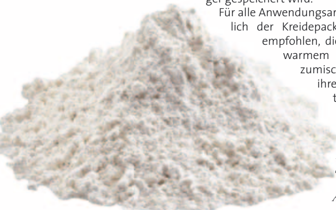
Die Heilkreide ist ein reines Naturprodukt und für Allergiker geeignet.

Für alle Anwendungsarten hinsichtlich der Kreidepackungen wird empfohlen, die Kreide mit warmem Wasser anzumischen, da sich ihre Komponenten im wär-